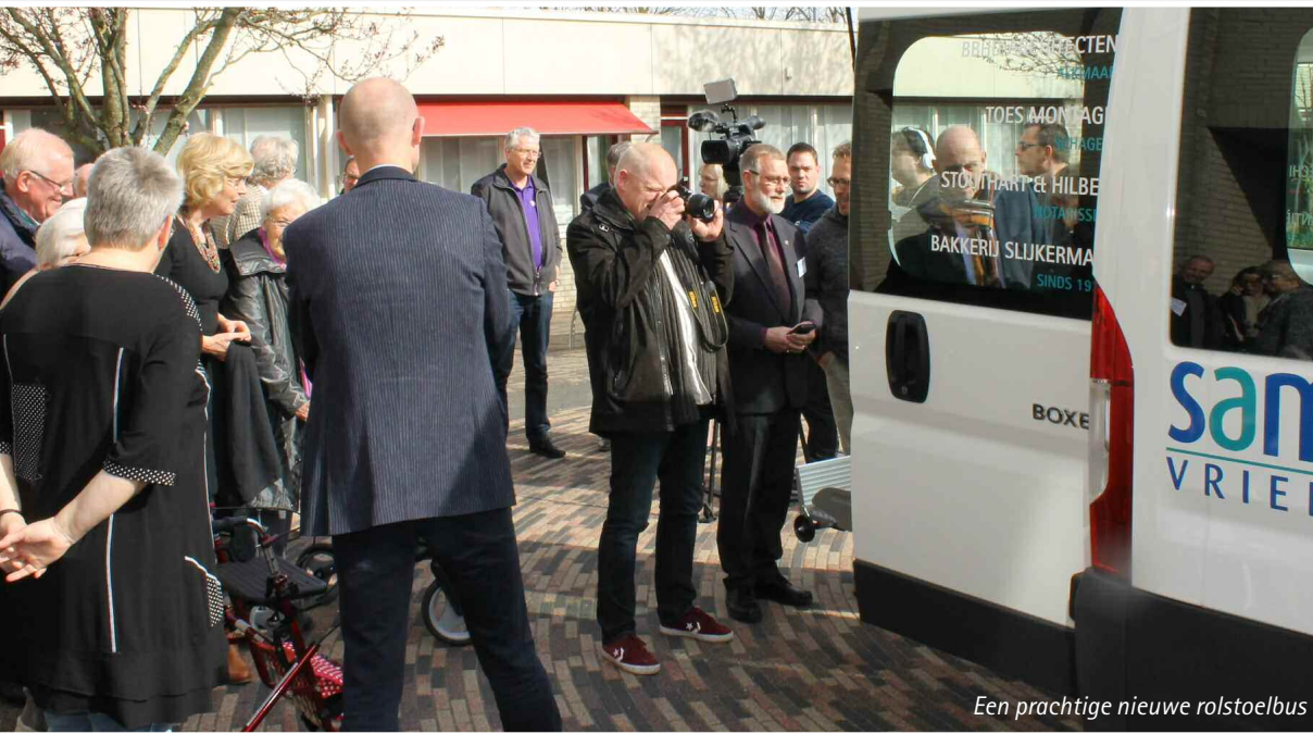
Een prachtige nieuwe rolstoelbus

Een wederom prachtig jaar voor de Samen Vrienden en daardoor ook voor de bewoners van de Woonzorggroep Samen. Want gaat het goed met ons, dan gaat het ook goed met hen. Zo ging in maart onze splinternieuwe rolstoelbus de weg op, was het het laatste jaar van de vaarvakantie, kwam er een beleef tv in de Elshof en was de oliebollenverkoop weer bijna op het niveau van voor de crisis. Veel plezier met het lezen van ons jaarverslag.