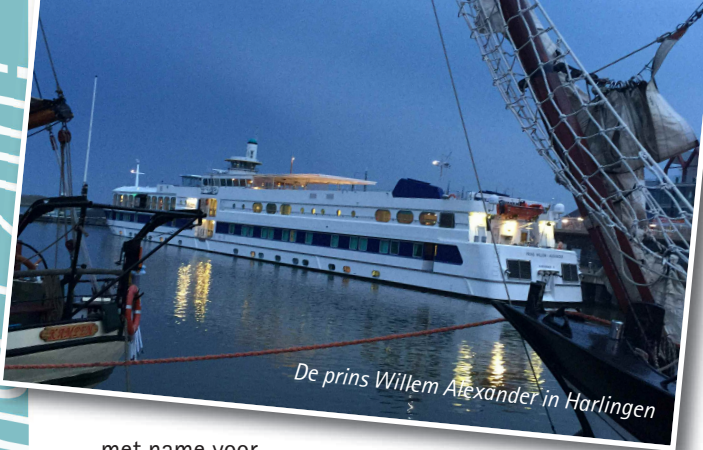
De prins Willem Alexander in Harlingen

met name voor de vrijwilligers extra emotioneel. Aan een lange traditie is met het afschaffen van de vaarvakantie een einde gekomen. Samen vrienden heeft het jarenlang voor de bewoners mede mogelijk gemaakt deze vakantie te kunnen maken. Per week gingen er 50 cliënten mee, en werden vergezeld door medewerkers en vrijwilligers van de Woonzorggroep Samen en een arts. De vakantievierders kregen een uitgebreid programma voorgeschoteld waar ook verschillende artiesten aan meewerkten.